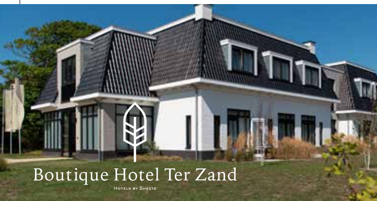
Boutique Hotel Ter Zand

Op een unieke locatie in Zeeland, dichtbij natuurgebied De Zeepe Duinen en het strand van Westerschouwen, vind je sinds circa anderhalf jaar het luxe Boutique Hotel Ter Zand . Perfect om heerlijk te genieten van alles wat de veelzijdige Zeeuwse kust te bieden heeft.